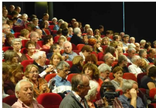
Le public chanceux d'avoir pu avoir des places pour le concert qui a très vite affiché complet.

Dimanche à La Vence Scène, les Saint-Egrévois ont assisté à un très grand spectacle en ouverture du 13 e festival de Grenoble Alpes Métropole. Ce concert, interprété par le "Big Band Solis'Airs", les élèves et professeurs de l'atelier chanson et du département "jazz et musiques actuelles" de L'Unisson, s'intitulait "Imagine... The Beatles" et rendait hommage aux quatre garçons dans le vent. Paul McCartney, George Harrison, John Lennon et Ringo Starr.