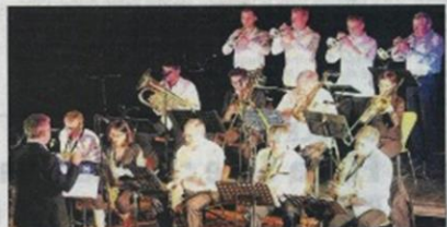
Le Big Band comprend des saxophonistes, des trompettistes, des trombonistes.